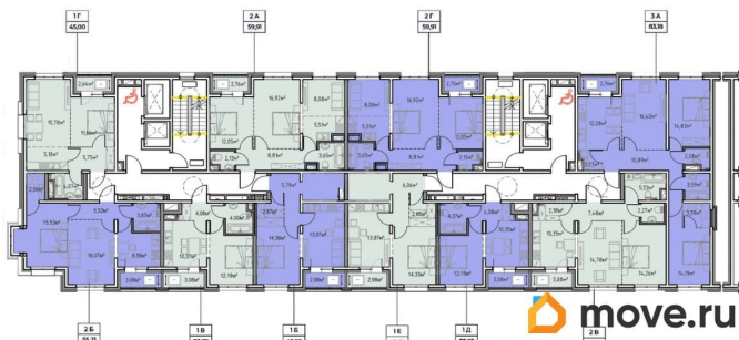
Блок секция 32