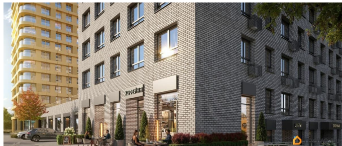
Союз PRIORITY БИЗНЕС