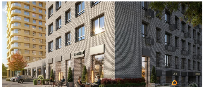
Союз PRIORITY БИЗНЕС