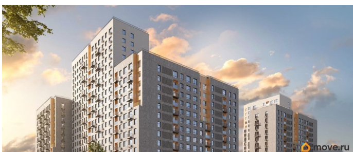
Союз PRIORITY БИЗНЕС